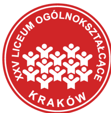
Rys. 3. Logo szkoły